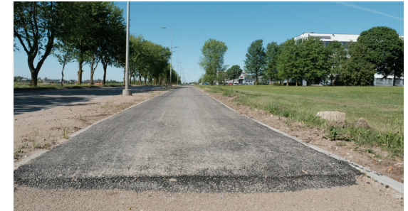
Naujosios g. takas