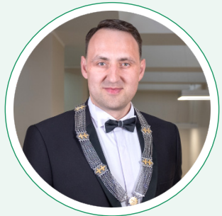
Alytaus meras Nerijus Cesiulis